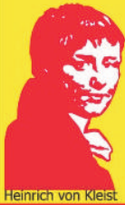
Heinrich von Kleist